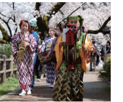
前回繰り歩きの様子